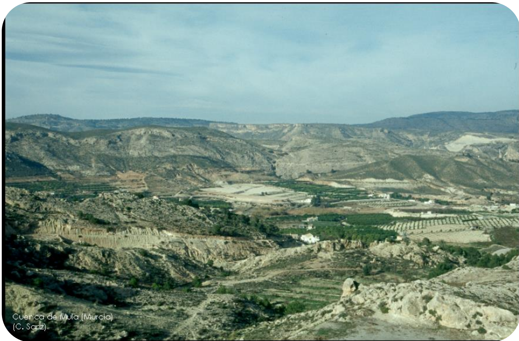
Cuenca de Mula (Murcia) (C. Sanz)